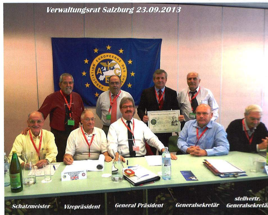
Schatzmeister Vizopřäsident General Präsident Generalsekretär Generalsekretär stellvert.