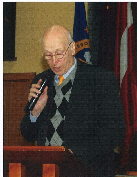
LDzB revīzijas komisijas ziņojums – J.Mukāns