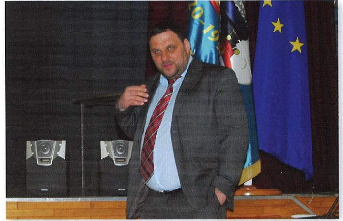
SM Dzelzceļa departamenta direktors Jānis Eiduks