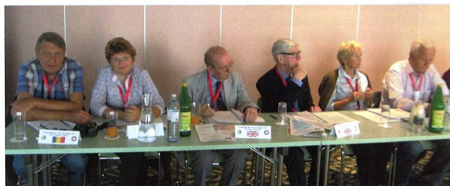
Administratīvās Padomes sēdē – Rumānijas, Lielbritānijas un Latvijas sekcijas pārstāvji