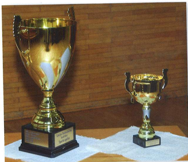
Jaunais LDzB ceļojošais Sporta kauss, LDzB ITA kauss "Izcils dzelzceļa inženieris"