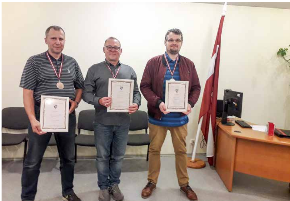
Pirmo līdz trešo vietu ieguvēji zoles turnīrā “Pīķa kungs 2021”.

2021. gada 26. augustā Latvijas Dzelzceļnieku biedrības telpās, Dzirnāvu ielā 147 k-3, norisinājās nu jau ierasti piekto gadu pēc kārtas Inženiertehniskās apvienības organizētais zoles turnīrs “Pīķa kungs 2021”.