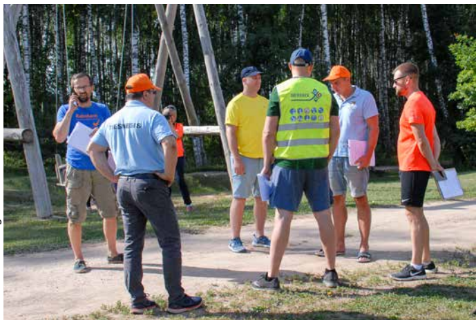
Sporta sacensību iesākuma atbildīgākais mirklis – komandu kapteiņu un tiesnešu korpusa vadītāju kopsapulce.