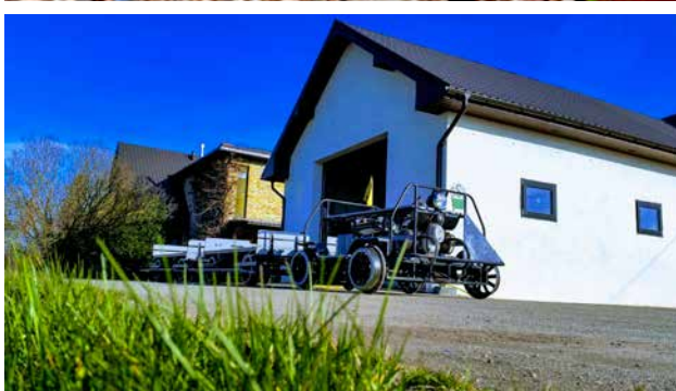
Restaurētā motodrezīna TD-5.