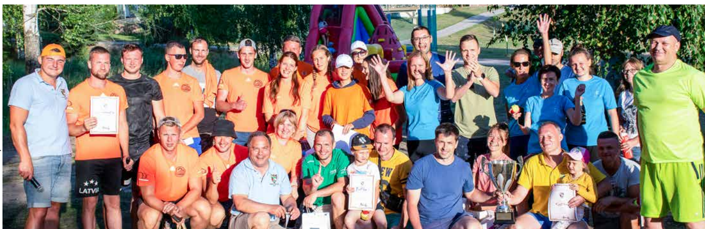
Uzvarēja draudzība jeb "Lokomotive Kustībā"!