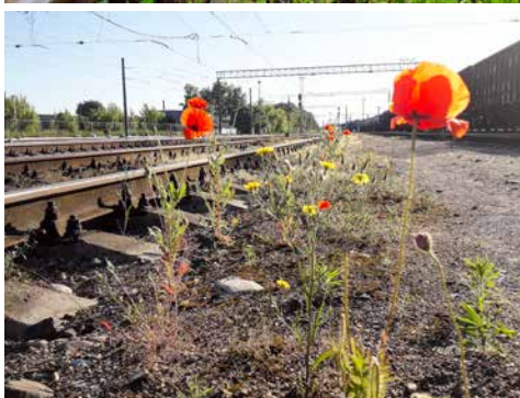
Dzīve skarbos apstākļos.