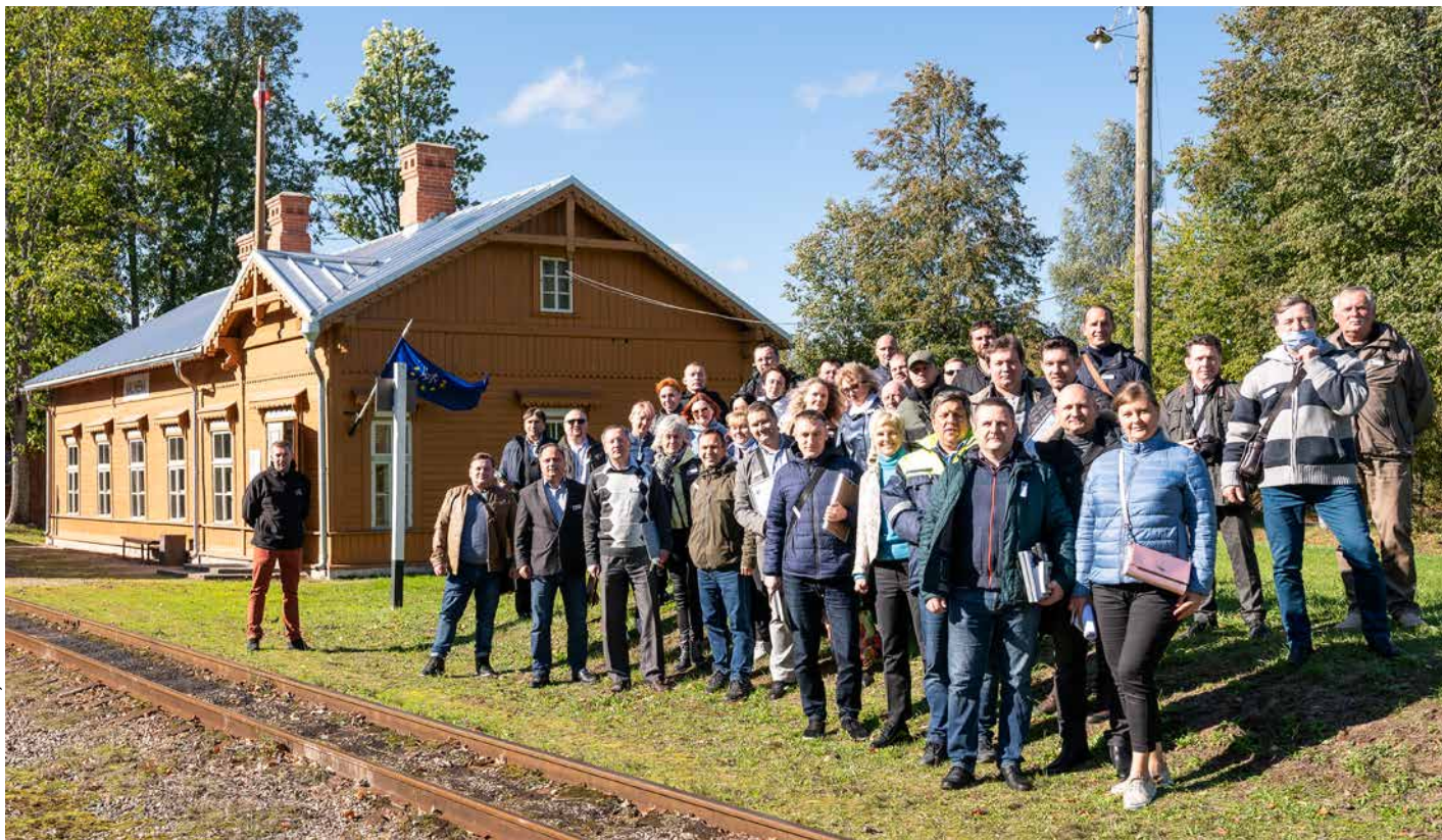
2022. gada Inženieru dienas dalībnieku kopbilde.

18. septembrī Gulbenē pulcējās dzelzceļa inženieri no visas Latvijas, lai parādītu un pārbaudītu savas spējas draudzīgā, bet azartiskā gaisotnē. Jubilejas 20. Inženieru dienā piedalījās Liepājas un Jelgavas apvienotā komanda “Pārmaiņu vējš”, Daugavpils komanda “Latgale”, bet Rīgu pārstāvēja komanda “Kaimiņi”.