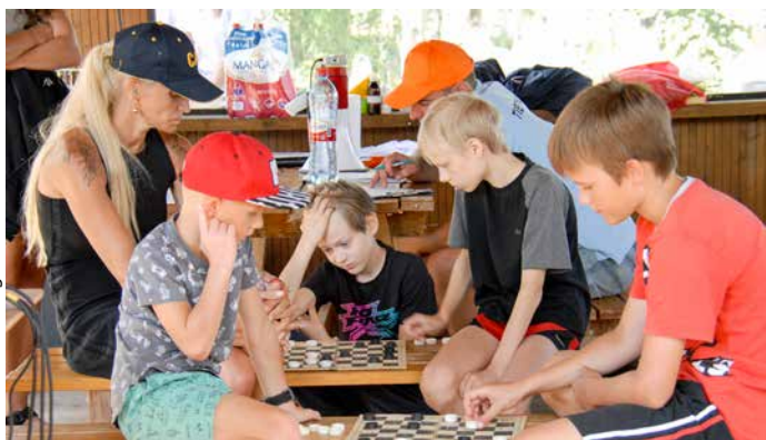
Galvas "kūp" arī jaunajai paaudzei.