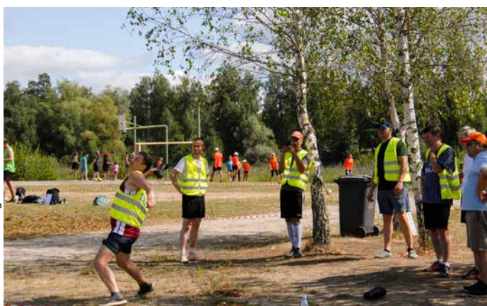
Lielāko sajūsmu "BERERIX" komandai izsauca dalība zābaka mešanas sacensībās.