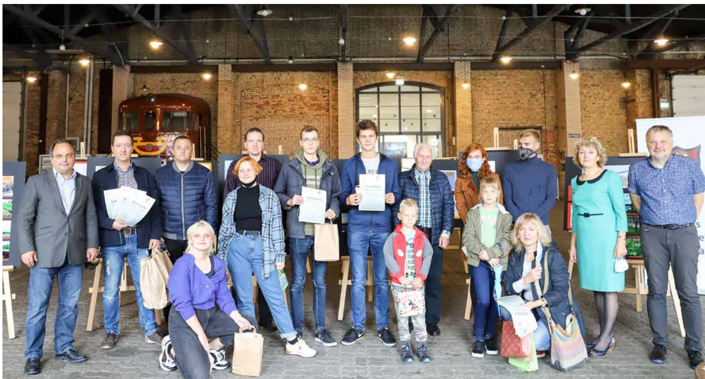
Zīmējumu un fotogrāfiju konkursu noslēguma pasākuma dalībnieku kopbilde.

Nu jau to var uzskatīt par kārtējo (šoreiz 2021. gada) zīmējumu konkursu, kura aktuālā devīze bija “Nākotnes dzelzceļš”. Tas ļāva bērniem pasapņot, aizlidot savās domās tālā nākotnē un pievērsties savam redzējumam par dzelzceļu. Varbūt atsevišķos gadījumos bija jūtama arī vecāku klātbūtne, bet tas nemazina bērnu un jauniešu ieguldījuma nozīmi.