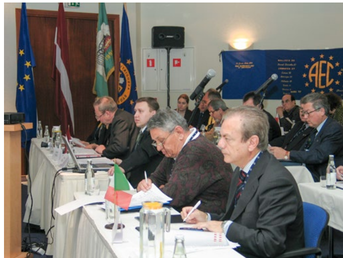
A.E.C. Latvijas sekcijas organizētās 2004. gada Eiropas dienas norisinājās Rīgā.

Savas pastāvēšanas laikā A.E.C. Latvijas sekcija divreiz rīkojusi arī tā dēvētās A.E.C. Eiropas dienas – galveno asociācijas biedru kopā sanāksšanas pasākumu, kura ietvaros tiek nosprausti organizācijas globālie mērķi un uzdevumi,