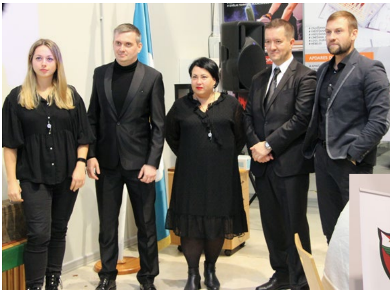
Komandas "Men in Black" nosaukums vēl neliecina, ka tajā iekļauti tikai vīrieši.