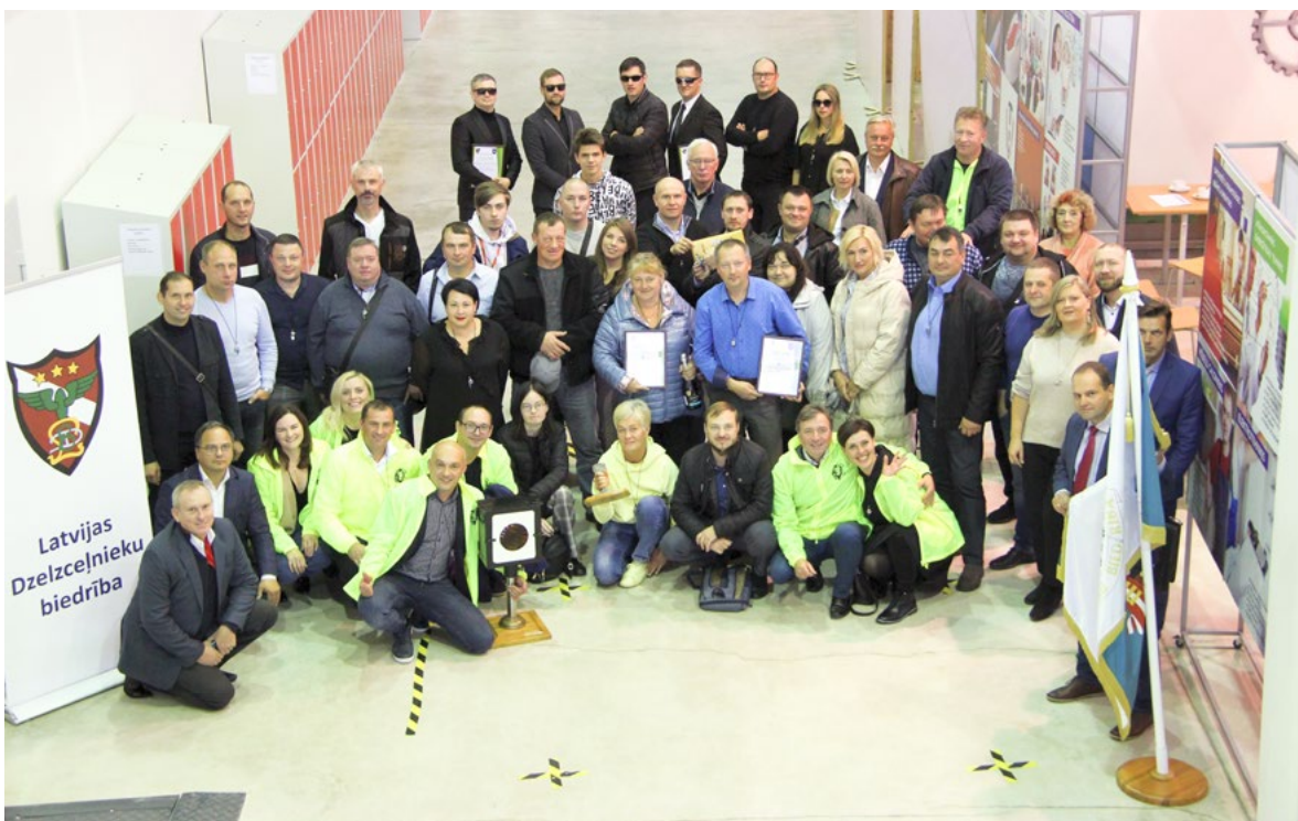
2022. gada Inženieru dienas pasākuma dalībnieku kopbilde.

Dalību pasākumā bija pieteikušas sešas komandas. Šoreiz viskuplāk, ar četrām vienībām: "Rīgas Valsts tehnikums", "Kaimiņi", "Men in Black" un "Asmeņi", tika pārstāvēts Rīgas reģions. Trīs no tām pirmo reizi piedalījās pasākumā, bet "Kaimiņi" bija ieradušies kopā ar 2021. gada uzvarētāju trofeju – pārmijas signāllāketni. Inženieru dienas uzticamākās komandas "Mītava" no Jelgavas un "Septiņos vējos" no