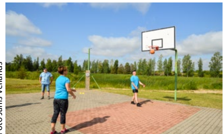
Basketbola soda metienu izpildes kvalitāti varēja apskaut neviens vien profesionālis.