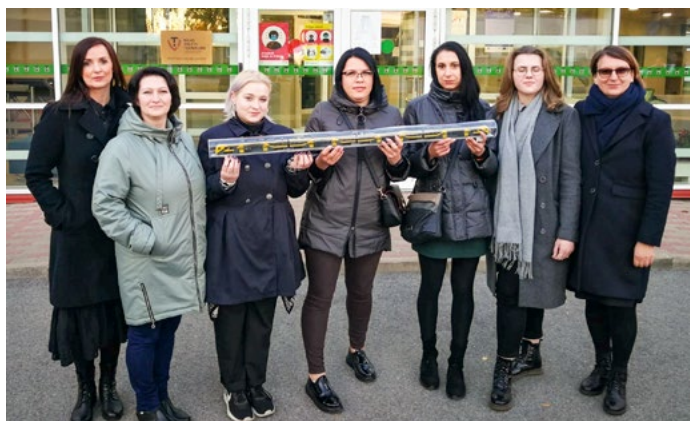
Topošās jauno elektrovilcienu vadītājas

Rīgas Valsts tehnikuma Pieaugušo izglītības centrā 2022. gada 12. oktobrī profesionālās tālākizglītības programmā “Lokomotīvu saimniecības tehniķis” mācības uzsāka 14 izglītojamie. Izglītības procesa rezultātā tiek sagatavoti lokomotīvu saimniecības tehniķi, kuri tuvākajā laikā vadīs jaunus “Škoda” elektrovilcienus.