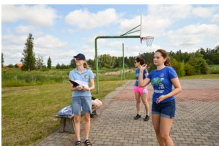
Starp individuālajām disciplinām vislielākā piekrišana bija šautriņu mešanas disciplīnai.