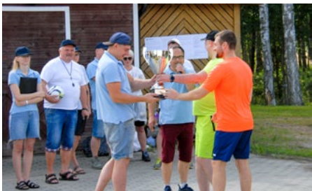
2021. gada komandu sacensību uzvarētāji nodod ceļojošo kausu glabāšanai sacensību galvenajam tiesnesim.