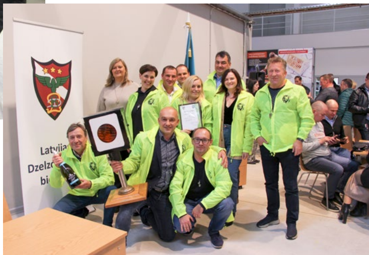
Uzvarētājkomanda "Septiņos vējos" ar izcinito trofeju – signāllāketni.