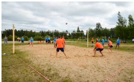
Komandu sporta veidos dinamiska cīņa ritēja ikvienā laukuma kvadrātmetrā.