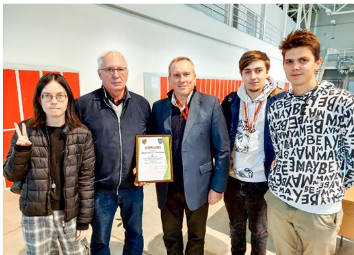
Inženieru dienas Rīgas Valsts tehnikuma komanda.

2022. gada oktobra pirmā nedēļa bija veltīta karjeras izglītībai Rīgas Valsts tehnikuma (RVT) Dzelzceļa nodaļā. Šogad pasākuma mērķis bija Dzelzceļa nodaļas audzēkņiem veicināt interesi par izvēlēto profesiju un pozitīvu priekšstatu par nākotnes darba iespējam nozarē, kā arī stiprināt savu piederību tehnikumam.